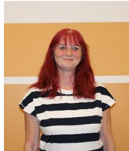
Frau Glade Bezugsgruppe 3d